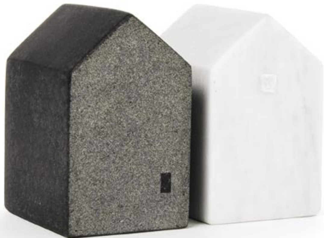
Hus 15, hus 16